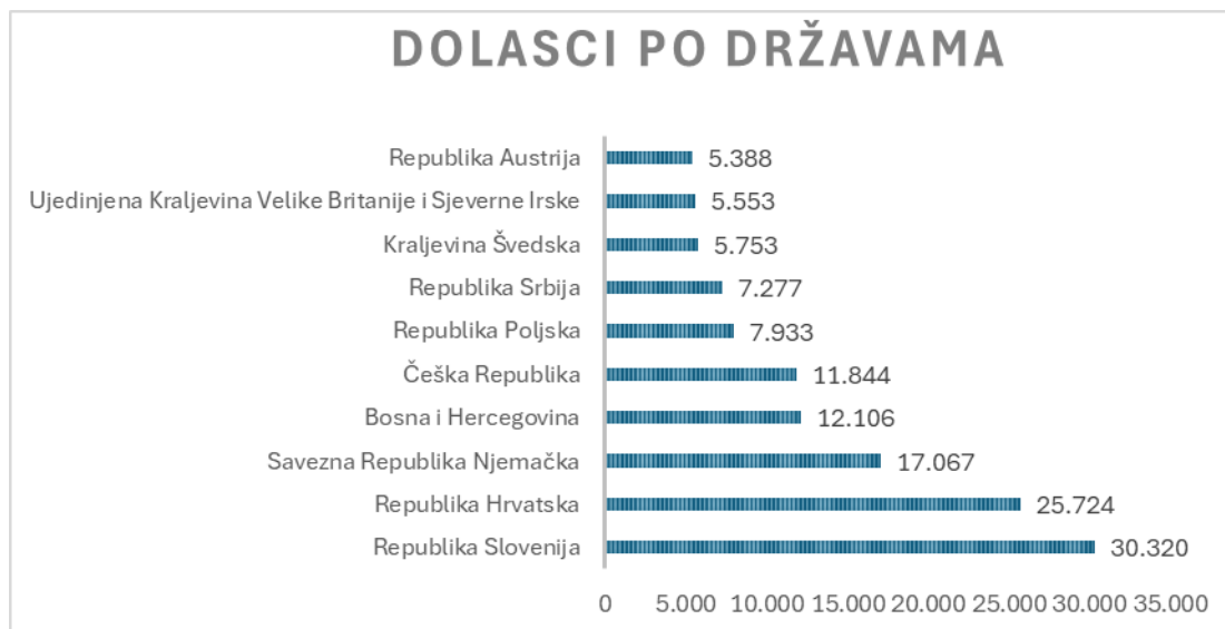
Grafikon 1 Dolasci po državama 2024. godine u razdoblju od 01.01.2024.- 31.10.2024.

Na Grafikonu 1 prikazani su dolasci po državama za razdoblje od 01.01.24. do 31.10.24. iz kojeg je vidljivo kako je većina gostiju koji su posjetili otok Šoltu bila iz Slovenije i Hrvatske. Slijede gosti iz Njemačke, Bosne i Hercegovine, Češke, Poljske, Srbije, Švedske, Ujedinjenog kraljevstva i Austrije.